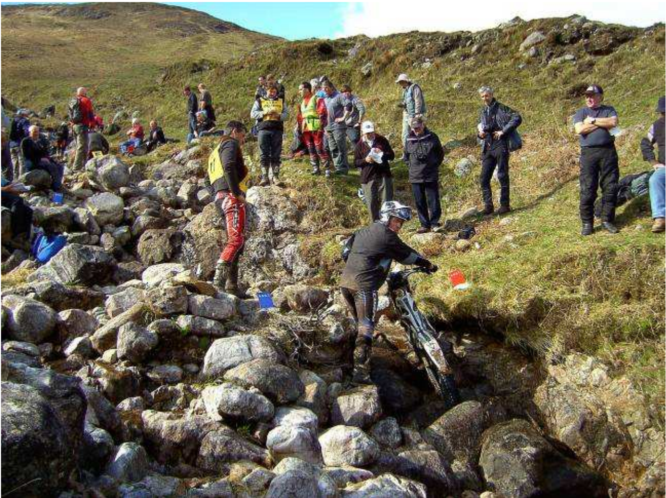
Kilmalieu Sektion 4

Fahrt im Auto bis zum Parkplatz Coran Ferry, Überfahrt mit dem Velo (gratis) und Besuch der Sektionen Meal Nam Each, Kilmalieu und Ruba Ruadh. Wir verbringen den Nachmittag bei Kilmalieu. Wir sehen das gesamte Fahrerfeld in der Mittelsektion über die Steine fahren, hüpfen und fallen. Am eindrücklichsten sind da schon die 4 Frauen im Teilnehmerfeld. Ruhig und besonnen studieren sie die Sektionen und fahren mit guten Leistungen hoch. Die Männer hingegen schubsen und schieben an den Steinen rum, als ob 500 kg mit dem Fuss bewegt werden könnten. Vor allem die „Sektionenbauer“ sind oft doppelt beschissen, weil ein Vorfahrer in der Verzweigung mit viel Gas einen Riesenkuller genau in ihre Spur versetzt.