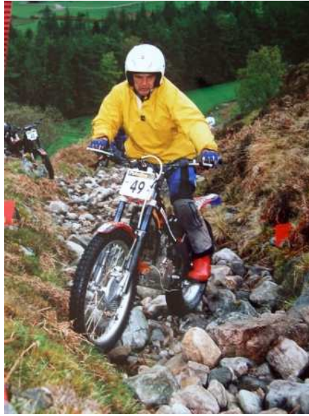
SSDT 2009 Honda 4 RTL