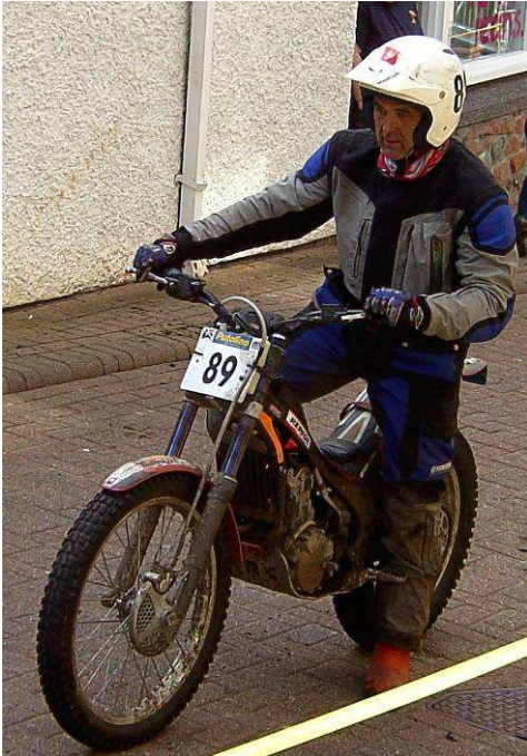
Town Hall Brae