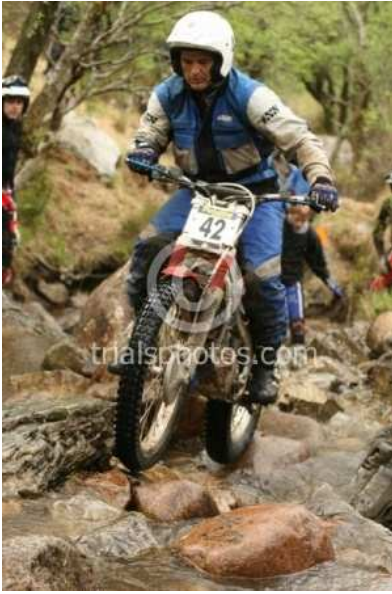
SSDT 2008 Honda 4 RTL