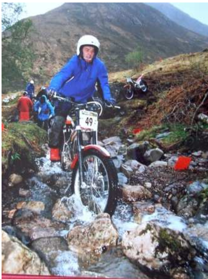
Uff, endlich geschafft!

Mein Blick gilt der Ebene vor mir; eine Wasserfläche und weit neben der markierten Piste. Es regnet immer stärker und der Wasserstand steigt jede Sekunde. Einfach durch – 4. Gang und Gas al Tope. Endlich steigt das Gelände wieder an und ich bin gerettet.