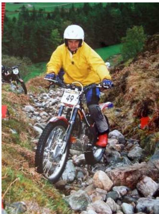
SSDT 2009 Honda 4 RTL