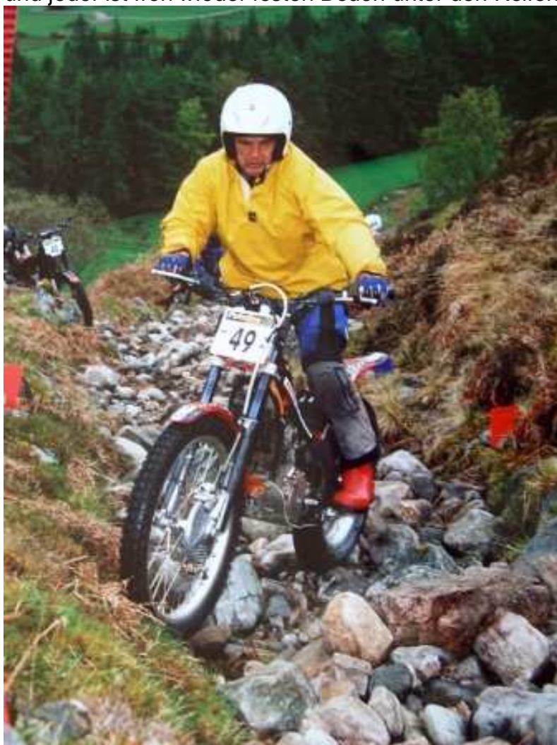
Laggan Locks 2009

Früher Start um 07:32 Uhr. Als erster Fahrer erklimme ich die Laggan Locks Sektionen. Nach der 40 Km Anfahrt auf der Strasse mit Wind und Regenschauer bin ich nicht der Einzige, der mit verkrampften Armen und Beinen in die 3 Sektionen einfährt. Alles Non-Stop und 150 Meter bergauf, auf Runden Steinen. Der Hinterradantrieb fühlt sich an wie auf einem Kugellager; die feuchten Steine drehen sich auf der Stelle und nix vorwärts, geschweige denn aufwärts. Zuwenig Speed denke ich mir und greife die 2 Sektion scharf mit viel Drehzahl im 1. Gang an. Erfolg schon besser – eine 3. Mit dem Schwung aus der 2. Sektion geht's direkt in die Dritte und die gelingt. Schönes Gefühl. Darauf habe ich ein ganzes Jahr gewartet. Der Jahrmarkt geht gleich weiter; eine happige Moordurchfahrt von ca. 40 Min. mit Sektionen am Ende der Welt, in der Nähe des Palastes des God of the Moors. Dieser hat sich wie Eingangs erwähnt mit dem Wetter verbündet und lässt giessen. Das Wasser schwallt in 1 Meter breiten Kaskaden die Wiesenhänge herunter und beschert uns volle Kanne. Da müssen alle durch und jeder ist froh wieder festen Boden unter den Reifen zu finden.