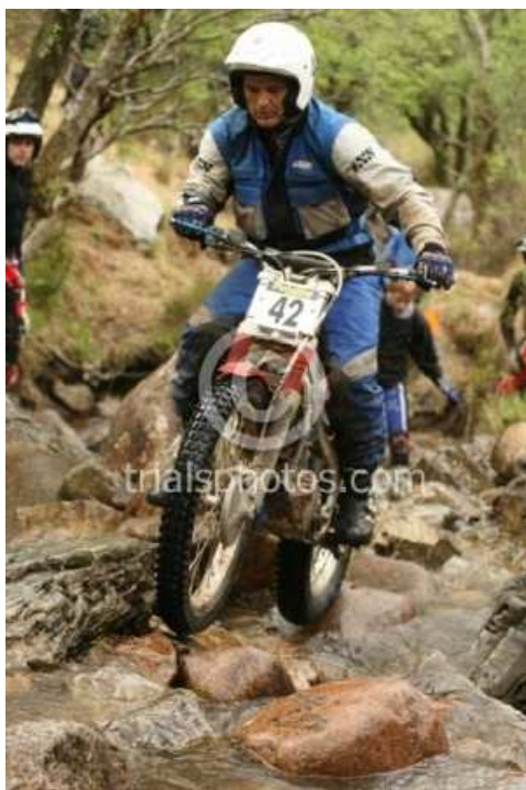
SSDT 2008 Honda 4 RTL