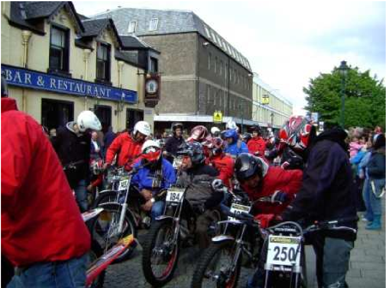
Cavalcade of Riders Main Street Fort William, Sonntag, 3. Mai 2009