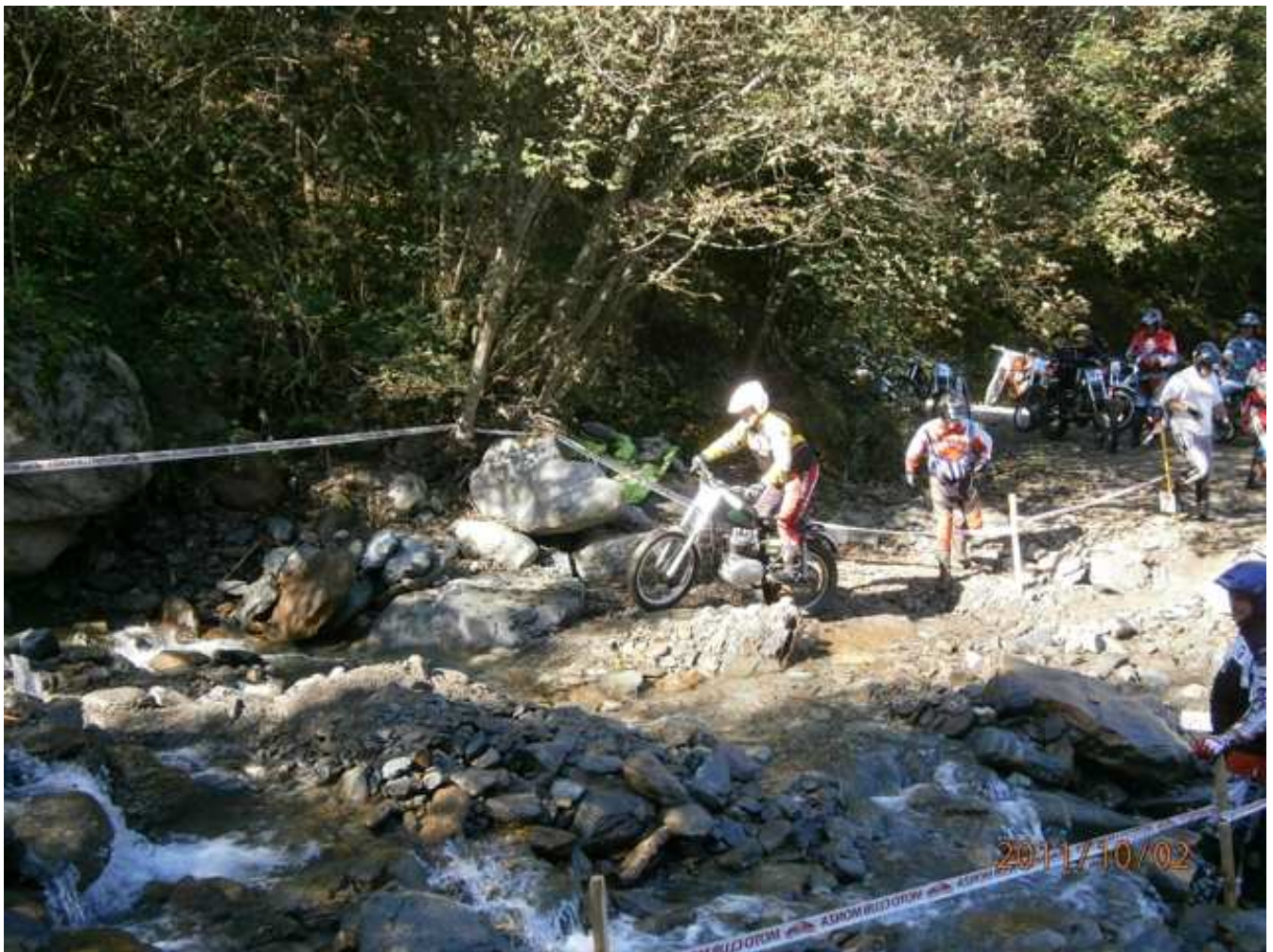
Edy Kämpfer in der Bachsektion 2