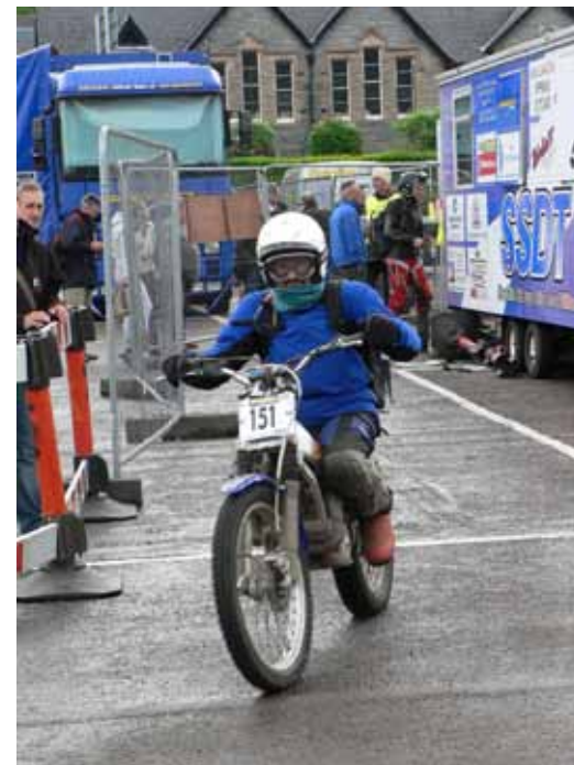
Start um 7.43 Uhr im Regen, vor mir liegen 40 Meilen Strasse zum Glen Coe.