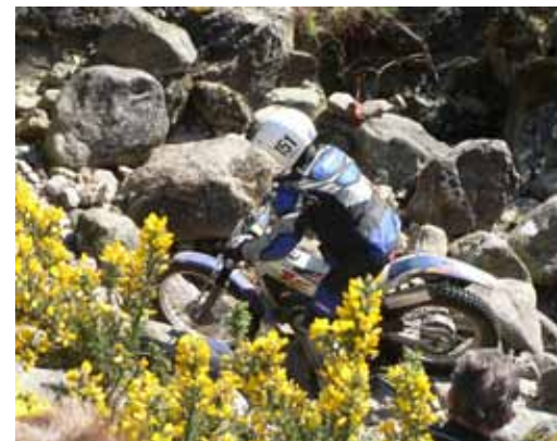
Ich will auch da hoch!

Laggan Locks, mmh das Wasser läuft im Munde zusammen wenn ich an die Sektion denke. Wunderschön zu fahren im oberen Teil (2 Sektionen NonStop) aber