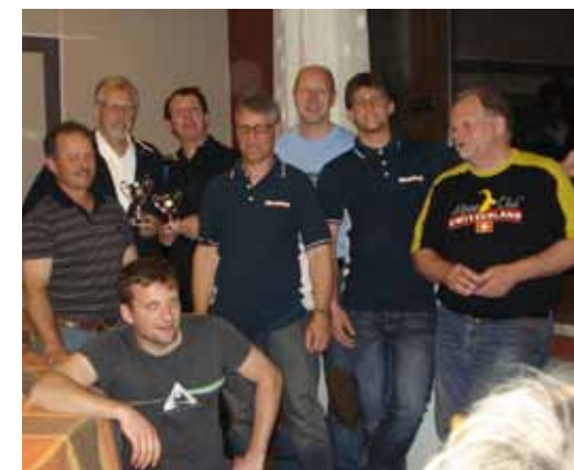
Die absoluten Köhner.