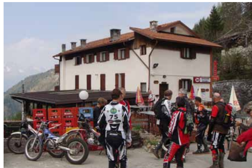
Zmittag im Belvedere.

Trial nicht teil, weil sie bereits am Freitagmorgen abgereist waren.