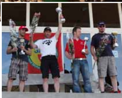
Die Gladiatoren der Spitzenklasse 3.