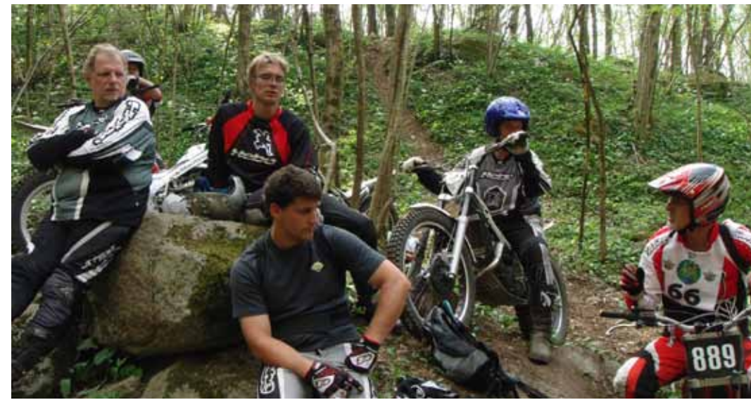
Die müden Krieger bei einer verdienten Pause.

19 Uhr hatten wir auch das letzte und langweiligste Stück Weg hinter uns gelassen und waren angekommen!