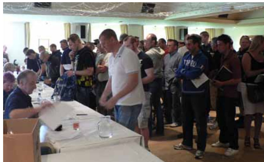
Andrang beim Einschreiben.

Sign In Procedure im Nevis Hotel und weiter zur Maschinenabnahme im Paddock des West End Car Parks, wo die Marshals vor dem Eintritt in den Parc Ferme den Rahmen und den Motor mit Farbe und Startnummern markieren.