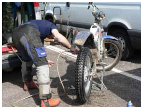
Es ist vollbracht...

Wir müssen nach der Moorpassage des Blackwater Reservoirs die Auffahrt beim Loch Treig nicht fahren, die Alternativroute führt schonend über einen Fussweg. Weiter nach Leanachan. Dort muss gemäss Energiepegel, taktisch vorgegan-