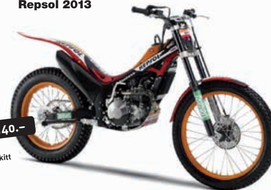
COTA 4RT Repsol 2013