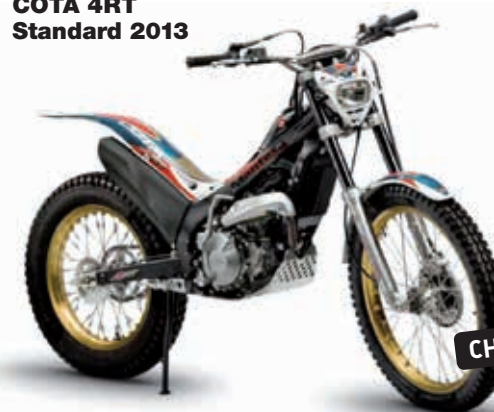
COTA 4RT Standard 2013