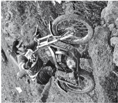
Ferdi Hasler, Bultaco 325

Eine Mannschaft besteht aus 3 Fahrern. Die Strecke ist ein geschlossener Rundkurs von ca. 700 m Länge. In diesen Rundkurs werden 5 Wertungsabschnitte