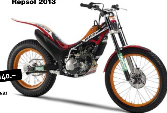
COTA 4RT Repsol 2013