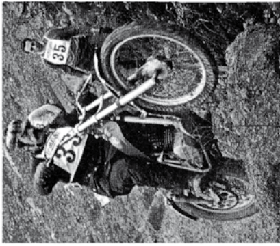
TWN-Junior Max Haueter auf Montesa.