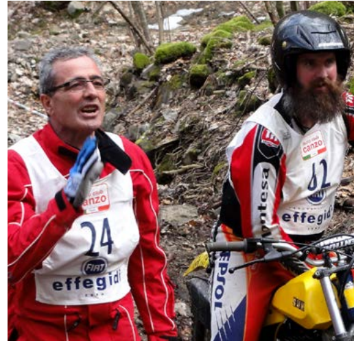
Fortsetzung von Seite 2