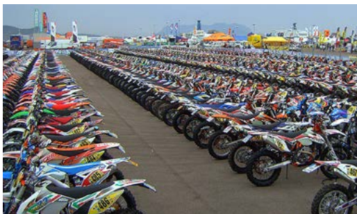
Parc Fermé auf dem Dock im Hafen von Olbia.

Auch hier in Sardinien haben es sich die Sheep Skull Enduro Riders nicht nehmen lassen, ihre britischen Landsleute und auch alle anderen Teilnehmer beherzt anzufeuern. Es gibt bei jedem Auftauchen der verrückten Truppe einen riesigen Volksauflauf und es fließt viel Bier.