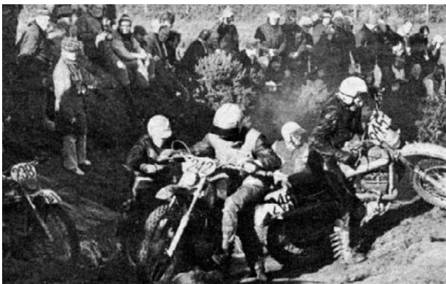
Hier könnt ihr im Internet stöbern: www.fim-isde2013.com/six-days/history.html

Die ISDE finden seit 1913 statt und gelten als Weltmeisterschaft im Motorrad-Geländefahren. Die Bedingungen der täglich zu befahrenden Geländestrecken nach Zeitvorgabe, verlangte zunehmend technische Verbesserungen an den Fahrzeugen und half die Entwicklung voranzutreiben.