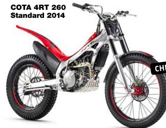
COTA 4RT 260 Standard 2014