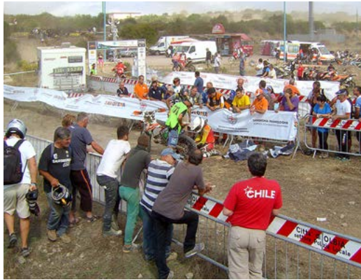
Beispiel 1: Am Ende der Sonderprüfung, nach der Zeitmessung schlingert sich 50 Meter Absperrband in den Hinterradkettenkranz. 10 Minuten verzweifeltes Freilegen des Bandes, bis es endlich wieder weitergeht.

Der Pannenteufel oder das Pech kleben an jedem Teilnehmer solcher Veranstaltungen.