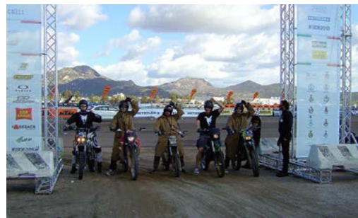
Standartausrüstung der Sheep Skull Enduro Riders: Schafwollmantel, Sonnenbrille und Honda.