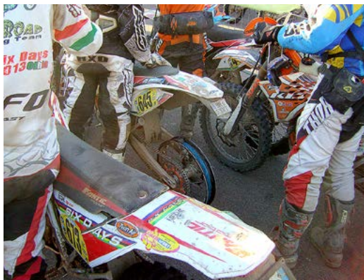
Beispiel 2: Zeitkontrolle abends im Parc Fermé: die Zeit reichte nicht mehr für's Pneu montieren.