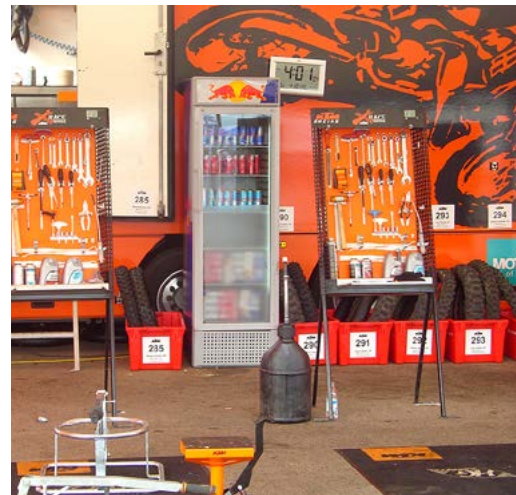
Fortsetzung auf Seite 12

Obwohl die Welt nicht Orange ist, konnte die Leaderstellung im Enduro Markt auch am Boxenzelt abgelesen werden: Für jeden Fahrer war ein Arbeitsplatz, eine