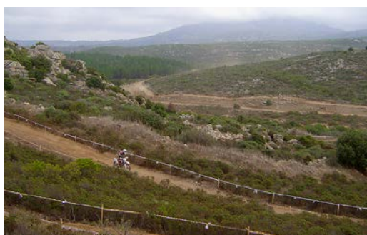
Sonderprüfung / Special Test in der typischen Vegetation der Gallura.