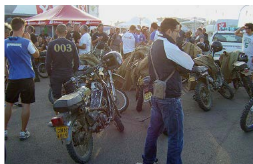
Mehr Infos unter: www.sheepskullenduroriders.com/page17.htm

Das erste Mal habe ich diese Truppe 1975 auf der Isle of Man angetroffen. Sie tauchen kurz auf mit ihren knatternden Honda Dax Motoren und verschwinden wieder. Damals waren sie noch nicht als Showtruppe organisiert. Beim Truppenhalt werden die braunen Schafhirtenmäntel auf einen Haufen geworfen und die Töffs irgendwo angelehnt oder abgelegt. Gaudi Pur!