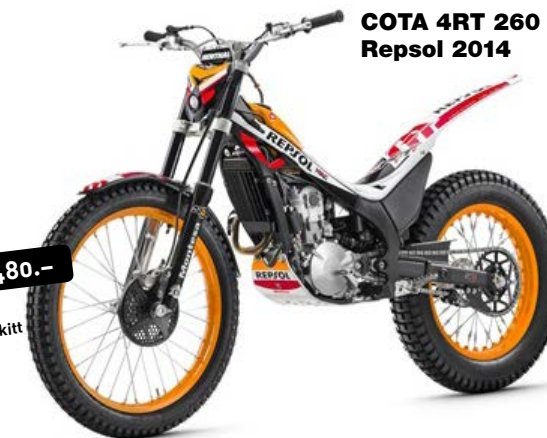
COTA 4RT 260 Repsol 2014