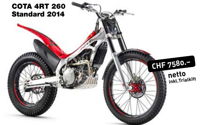
COTA 4RT 260 Standard 2014