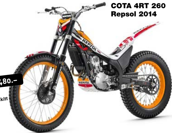
COTA 4RT 260 Repsol 2014