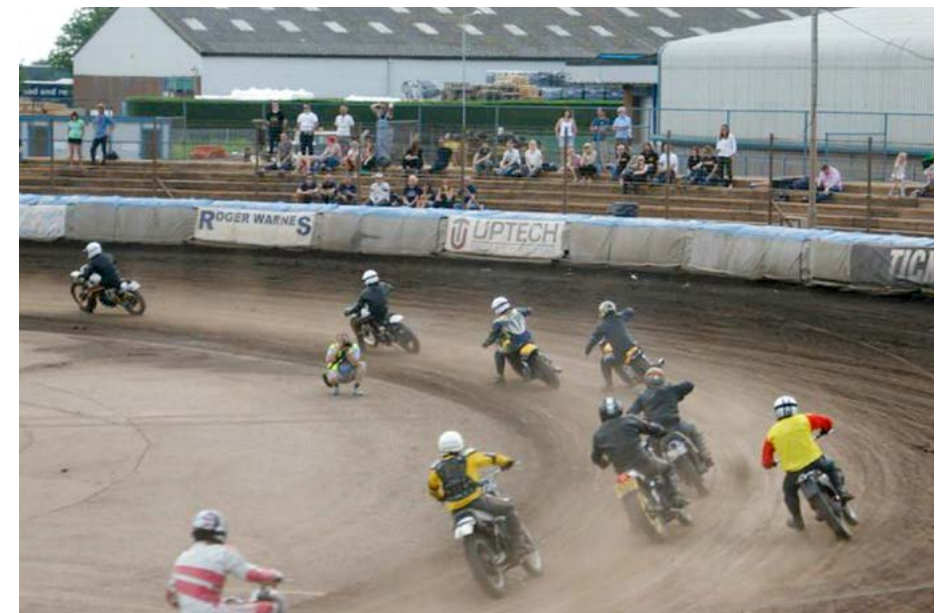
Kings Lynn, Dirt Quake III – the place to be!

Im ersten Lauf noch verhalten, verbessere ich mein Resultat im 2. Lauf als Dritter