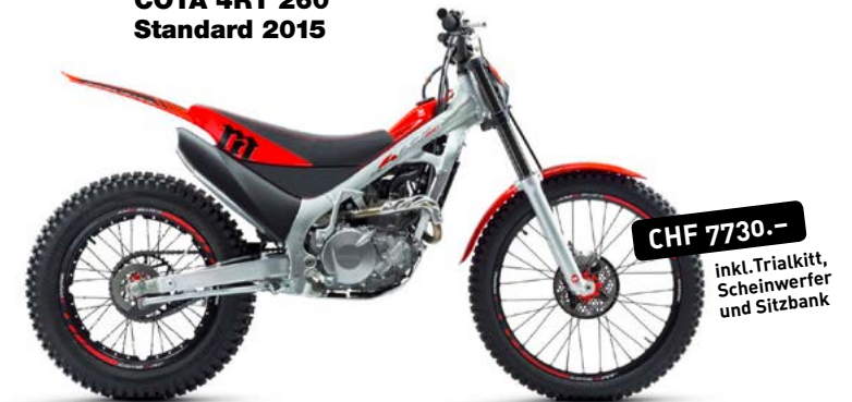
COTA 4RT 260 Standard 2015