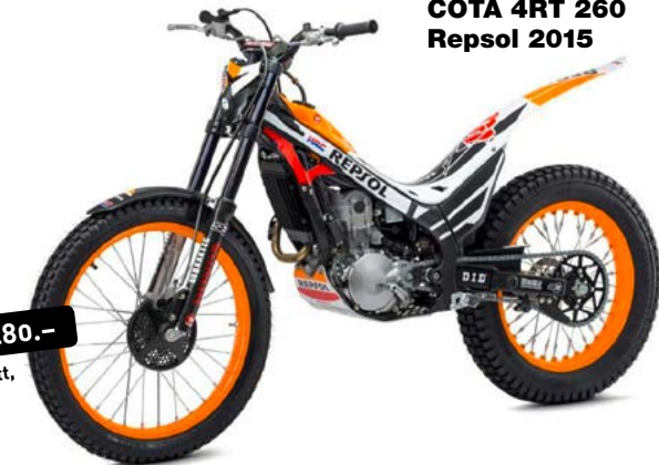
COTA 4RT 260 Repsol 2015

inkl. Trialkitt, Scheinwerfer und Sitzbank