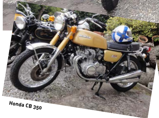
Honda CB 350