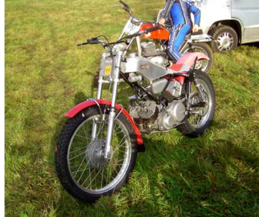
Ariel 2 Zyl/2-Takt