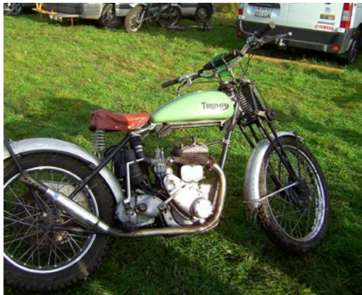
Triumph (German? English?)