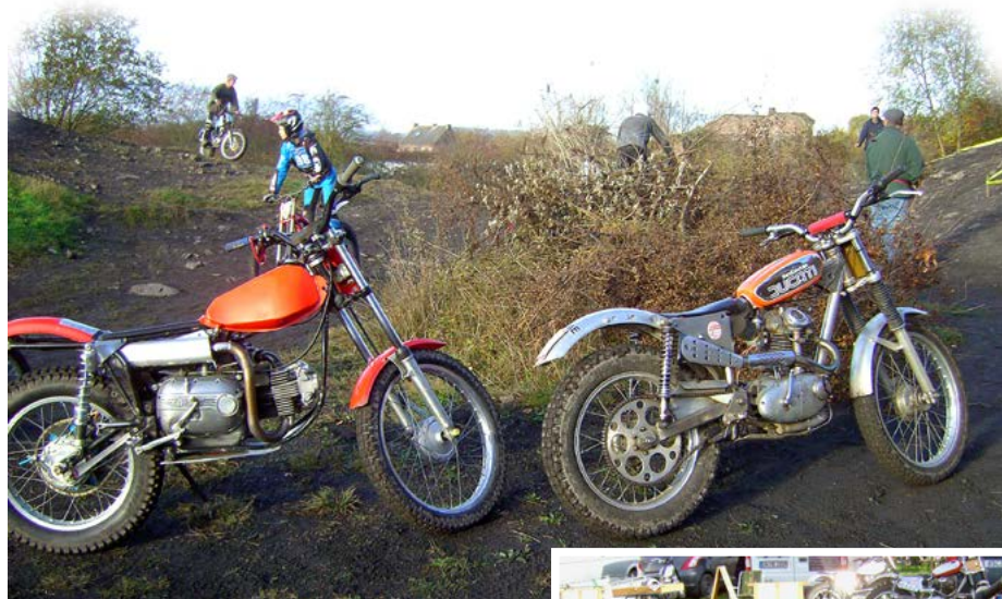
Solo 2 Moto Italiane, pero belle.

Terril de Ciplu ist ein mit Birkenwäldern und Dornenstreucher bewachsener, 50 Meter hoher Schutthaufen aus dem Kohleabbau. Durch die Regenfälle wird die künstliche Erhebung immer mehr abgetragen und bis in 100 Jahren wird er wohl verschwunden sein. Bis dahin werden die Trialfahrer dieses Gelände mit der alljährlichen Vintage-Trial Veranstaltung beleben.