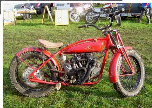
Es gibt keine Hemmschwellen: Museumsstücke wie diese Indian Scout 600cc / Jg.1928 werden elegant durch die Sektionen getrialt.

Die Sektionen sind für Clubmen und Experts ausgelegt, man kann sie auch mit Parallelogram Gabeln und Rigid Frames bewältigen. Die Herausforderung liegt in der Einzigartigkeit der eingesetzten Maschine. Je älter und authentischer, desto mehr Applaus und Anerkennung durch Zuschauer, Organisation und Mitfahrer.