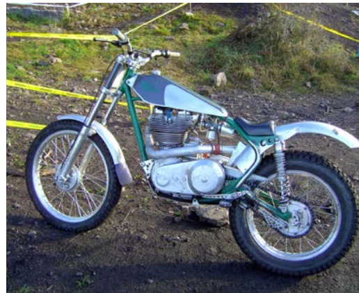
Royal Enfield (federleicht)

Von Velocette über Motobecane bis belgische FN war vieles vertreten. BSA wie Sand am Meer und die unter 100 Kg abgemagerten Oldtimer wie DOT, Greeves, BSA Bantam und 4 Gang Bultacos wurden in die Klasse Specials eingeteilt. Alle anderen Fahrzeuge wurden als Historics, Girder Forks, Rigid Framers, Separate Gearbox oder Units eingestuft.