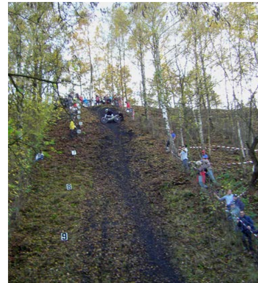
Riesengaudi, Applaus und viel Spass für Alle! 3 Versuche, möglichst weit rauf gibt weniger Punkte. Boden: Nasser Kohlestaub.