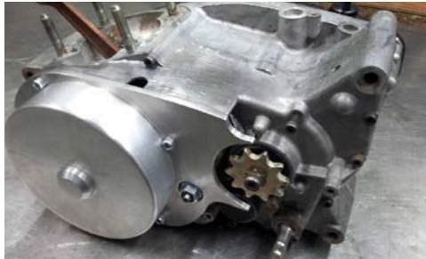
Dani baute auch einen neuen Seitendeckel aus einer Aluplatte und einem Alurohr, mit Schweißen.

35 Jahr später Importdokumente mit dieser Nummer gefunden. Gemäss Yamaha-Experte und damaligem Betreuer der Trial-Teams, Christian Aebi, sollen 20 Stück TY320 in die Schweiz importiert worden sein. Ich habe zudem eine Preisliste von