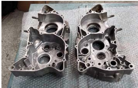
Dani scheut sich auch nicht vor Operationen am offenen Herz