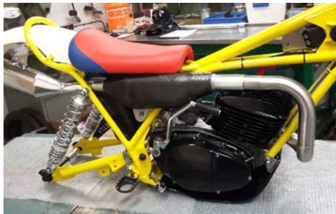
Das Projekt nimmt Form an.